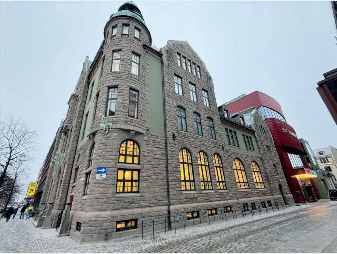
Det nye kunstmuseet er nærmeste nabo til Nye Hjorten Teater og Britannia Hotel, alt sammen eid av Reitan.