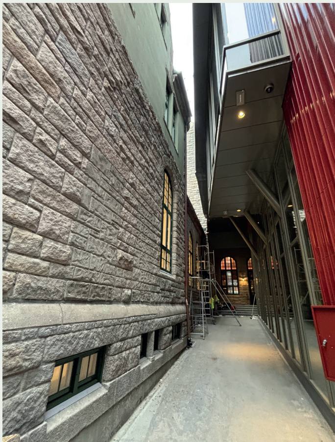
Det nye kunstmuseet ligger kloss inntil det nye teaterbygget, Nye Hjorten Teater.