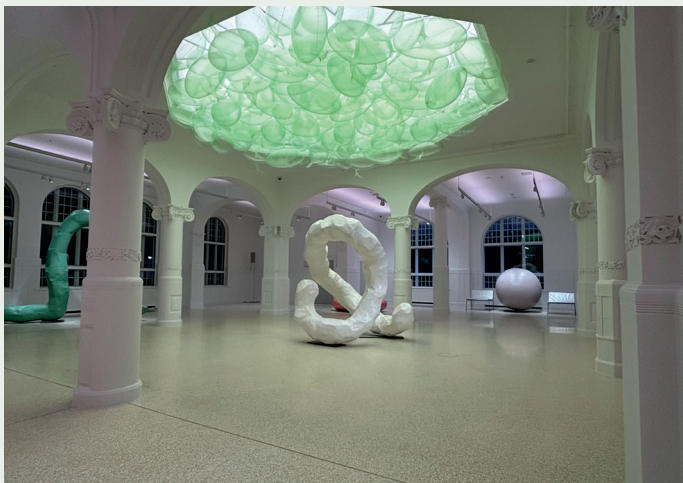
Det tidligere ekspedisjonslokalet for Postgården.