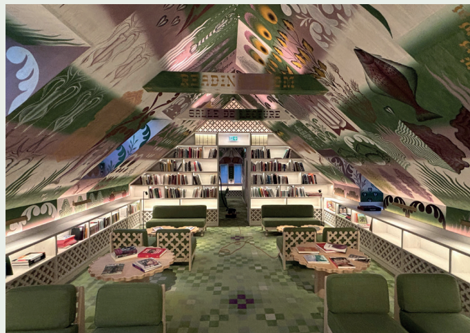
I leseværelset har interiørarkitekten engasjert nederlandske kunstnere som har malt tak og vegger.