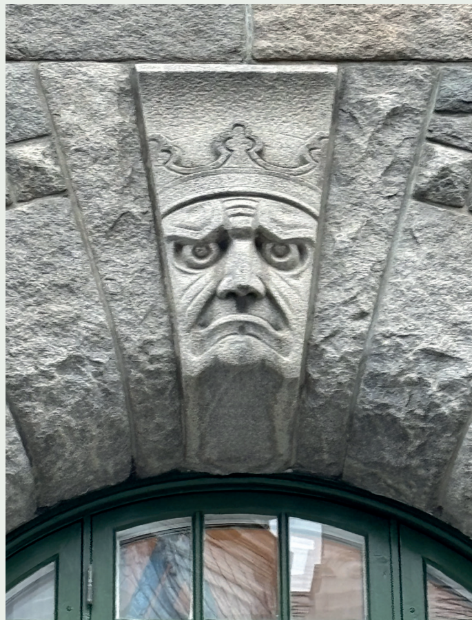
Humor i steinfasaden er tatt vare på.