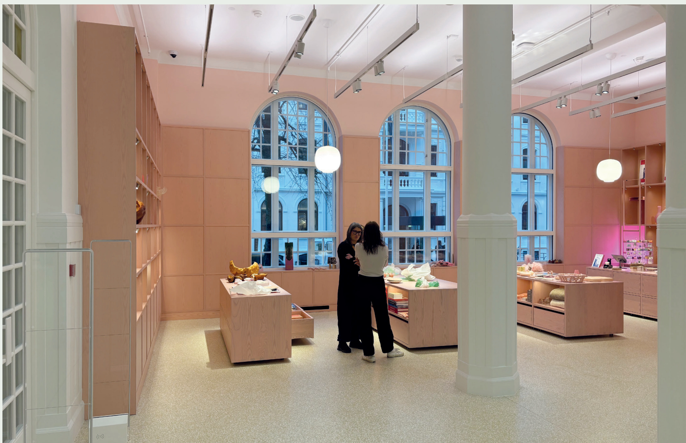
Museumsbutikken i ankomsthallen er holdt i rosa.