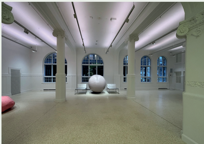
Monumental kunst i ankomshallen, tidligere ekspedisjonslokalet for Postgården.

etasje med tekniske installasjoner. Kjelleren har garderober, toaletter, vareinntak, tekniske rom og lager. Første etasje har hovedinngang, ankomsthall og museumsbutikk. Andre og tredje etasje rommer utstillingslokaler, mens fjerde etasje består av kontorer, møterom, selskapsrom og kjøkken.