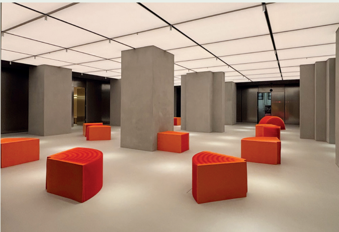
Den gamle kjelleren ble gravd ut for å gi mer høyde, og rommer nå garderober og toaletter.