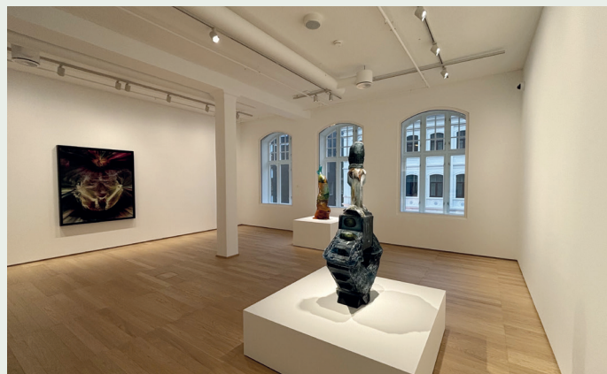
De store gamle vinduene slipper naturlig lys inn.