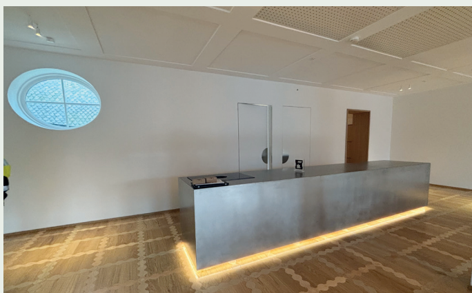
Fra selskapsavdelingen i fjerde etasje.

Vi har levert og montert stål- og aluminiumsprodukter, vinduer, dører og tak. Brannklassifiserte produkter.