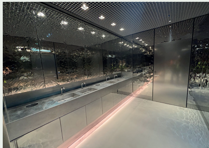
De bulkete platene glattes ut og blir til speil over vaskene.

ønsker ikke Kjøren å være for spesifikk. Den som måtte tro at banen er fri etter å ha tatt seg gjennom eikedøra ved siden av hovedinngangen, tar feil. På innsiden er det et stålgitter som stan- ser eventuelle uvedkommende etter åpningstid. Byggets gamle vinduer er beholdt, men på innsiden er det montert sikkerhets- glass. I tillegg vrirler det av sensorer og kameraer.